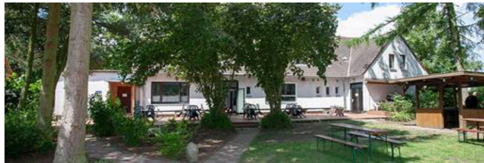
Ort des Zusammenkommens: NFH Luise-Wyneken

Wir – also die NaturFreund*innen in Niedersachsen und Bremen – wollen feiern, uns treffen, schönes erleben und positiv in die Zukunft schauen. Alle sind herzlich eingeladen am Sams-tag den 24. August nach Nienburg an die Weser zum Naturfreundehaus zu kommen. Genauso sind alle eingeladen sich vorab einzubringen und den Tag mit zu gestalten.