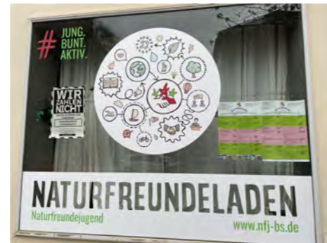
Die Geschäftsstelle Braunschweig

vielfältigen Aufgabengebiete der Mitarbeitenden viele Bereiche der Naturfreundejugend und der NaturFreunde zusammen und können so sehr gut von einander profitieren. Beispiele dafür sind zum einen das Südsee Openair, das neben der Live Musik dem Verein die Möglichkeit gibt, das Gelände am Braunschweiger Südsee mit all seinen aktiven Gruppen zu präsentieren, wie z.B. die Segeljugend oder die queere Jugendgruppe „Seidu“. Zum anderen planen die Schulkinder der Ganztagschulgruppen für das Gelände Vogelhäuser zu bauen, die dafür sorgen, dass sich mehr Blaumeisen in den Bäumen einnisten und im Sommer sich weniger Eichenprozessionsspinner breit machen.