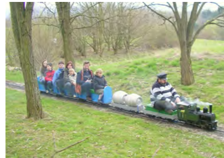
Für die Anreise/ das Vorprogramm sind die Ortsgruppen mit ihren Ideen gefragt

Weser in Anspruch nehmen möchte, kann sich ab sofort melden. Wer sich zuerst unter info@naturfreunde-nienburg.de meldet, bekommt den Zuschlag.