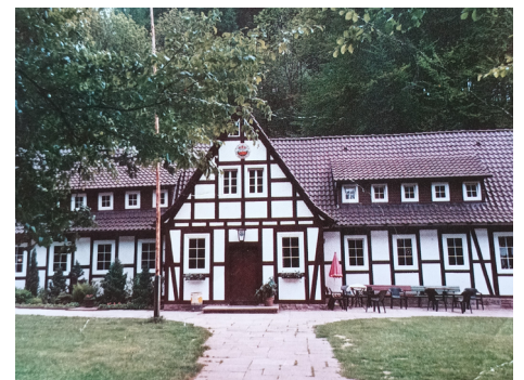
Haus Schneegrund in den 1970er Jahren