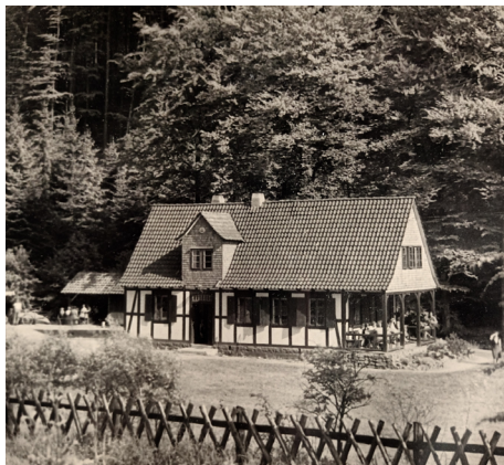
Haus Schneegrund in den 1950er Jahren

In den Sommermonaten wanderten wir zu Fuß. Bei schlechtem und kaltem Wetter mit der Bahn bis Schaumburg und nach einer guten Stunde waren wir wieder am Ort unseres Ziels, dem Schneegrund. Da das Haus von den Vereinsmitglieder ganz schlicht und einfach repariert worden war, schliefen wir am Wochenende im Strohlager unter dem Dach, dem sich im Erdge-